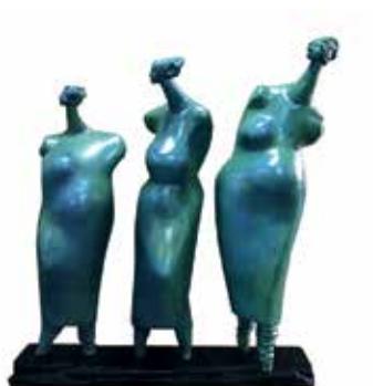
Salem, Les Femmes de Pêcheurs, sculpture en bronze et bois