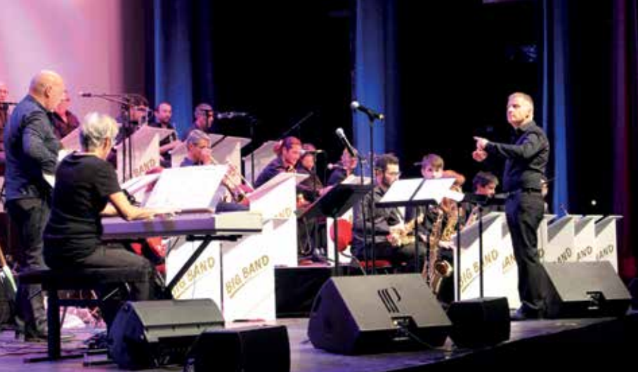
Concert du Big Band de La Grande Motte au Pasino pour le 100% Jazz 2016.