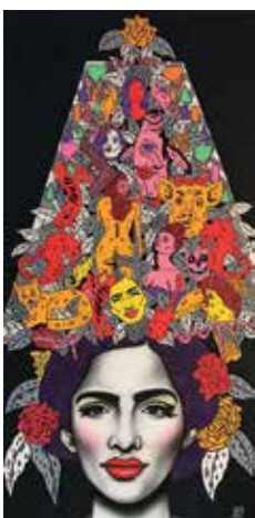
Bocaj, peinture réalisée en hommage au 50 ans de La Grande Motte

Cette année encore, deux invités d'honneur prestigieux, le peintre Bocaj et le sculpteur Salem, contribueront à la richesse du Salon Pyramid'Arts, devenu un événement incontournable de la Région. Au total, plus de 70 artistes, peintres, sculpteurs, photographes, illustrateurs et plasticiens exposent leurs œuvres. La sélection des candidats s'est élargie à toutes les disciplines, notamment à l'art numérique, et présente des artistes de tous horizons. Les exposants locaux, nationaux et internationaux, favorisent la qualité et la diversité qui font la notoriété de ce salon. Tous les styles sont représentés, du figuratif à l'abstrait. Toutes les techniques et supports, de l'huile à l'aquarelle, du collage au travail du bois, se déclinent sur les 800 m 2 du Palais des Congrès Jean Balladur.