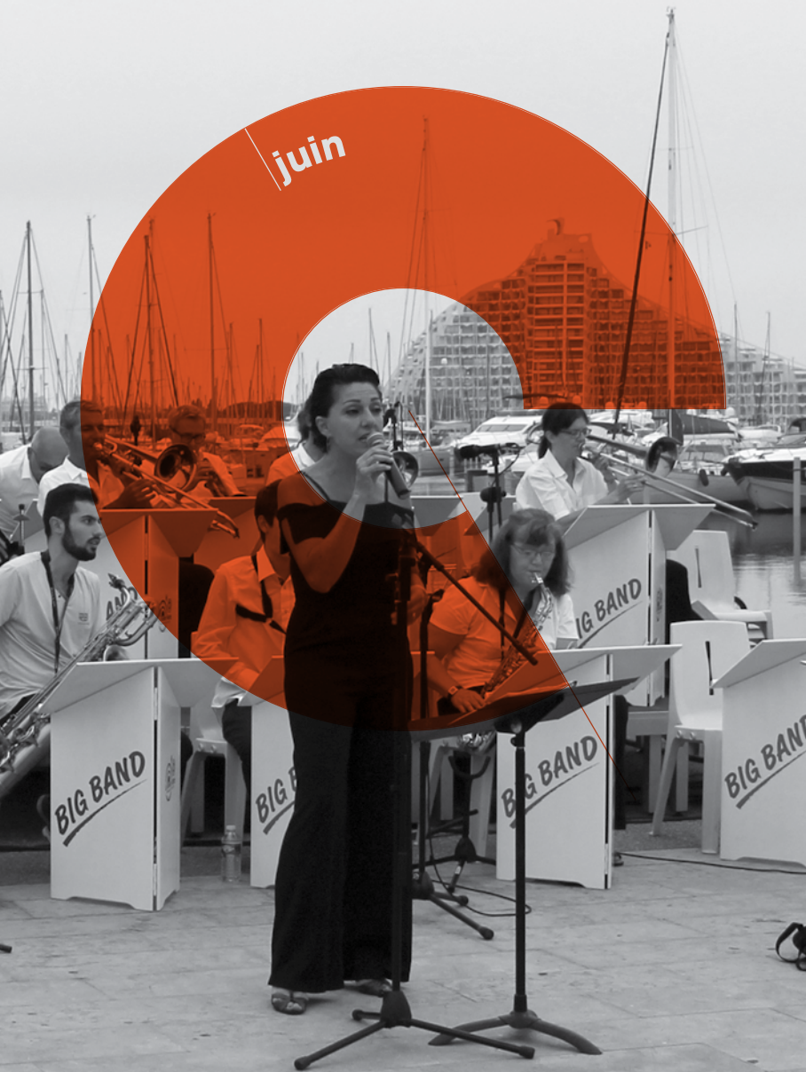
Concert de Jazz sur le Quai Charles de Gaulle par le Big Band de La Grande Motte lors de la Fête de la Musique 2017.